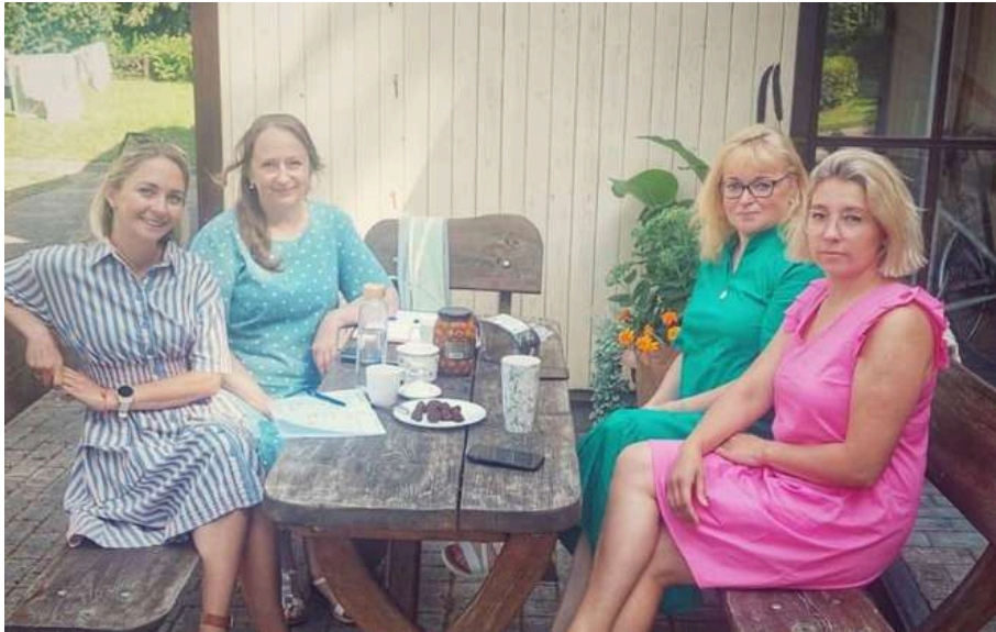
Ερευνητές του ERCC (αριστερά) και συμμετέχοντες σε συνεντεύξεις (δεξιά) - (Λιθουανία, Nida, 2022)

Τα δεδομένα αναλύθηκαν χρησιμοποιώντας τη μέθοδο θεματικής ανάλυσης, η οποία περιλαμβάνει την ανάγνωση των δεδομένων και τον εντοπισμό προτύπων στο νόημα για την εύρεση θεμάτων. Πέντε βασικά θέματα προέκυψαν από τα αποτελέσματα: ψυχολογικά προβλήματα, αιτίες ψυχολογικών προβλημάτων, πρακτικές για τη διαχείριση του άγχους και άλλων ψυχολογικών προβλημάτων, προκλήσεις και ευκαιρίες στην εφαρμογή της θεραπείας τέχνης που βασίζεται στην ενσυνείδηση και προδιαγραφές της επερχόμενης εφαρμογής που αναπτύσσεται.