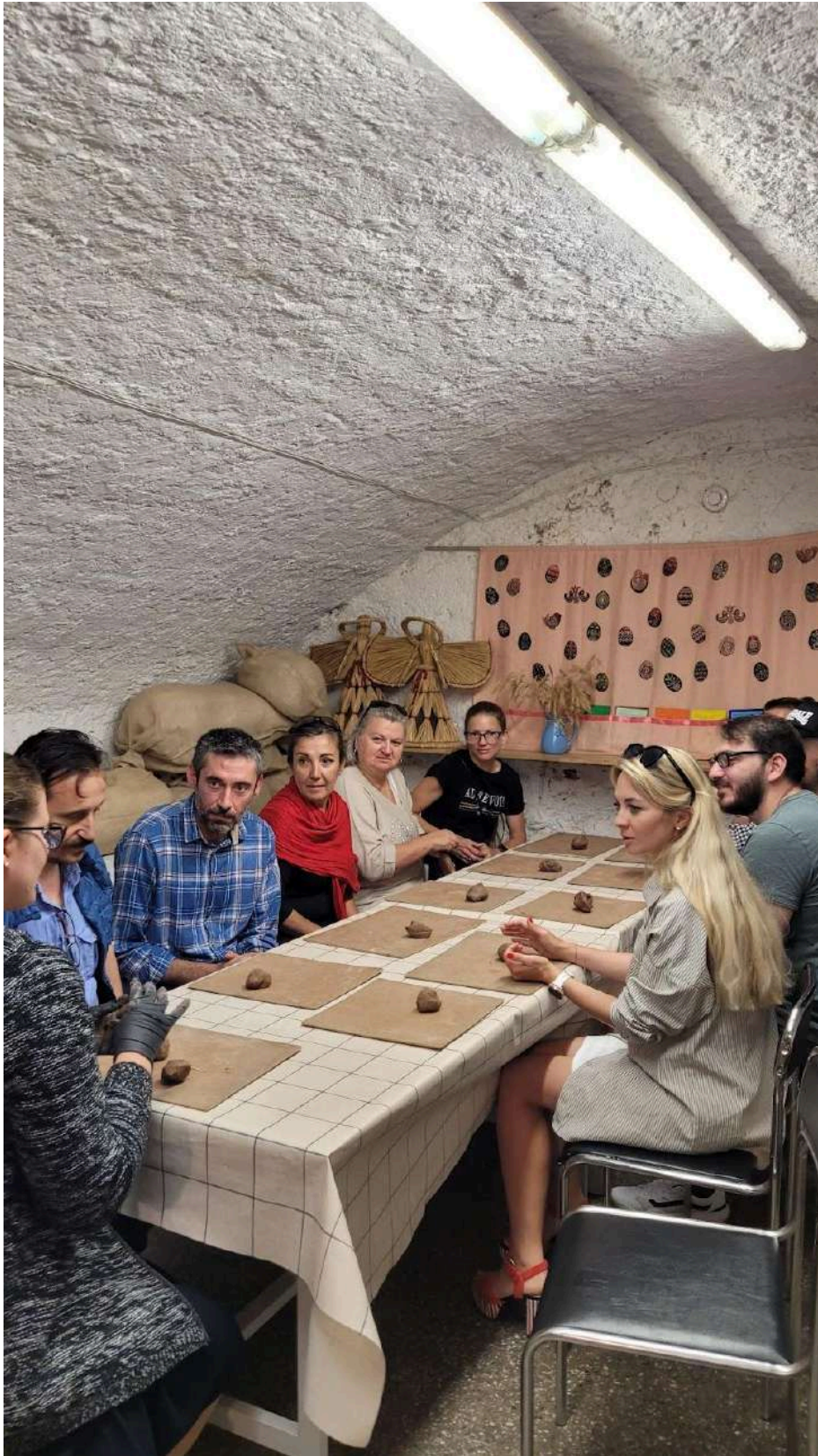
Συνεργάτες του πρότζεκτ φτιάχνουν πήλινα καλάθια, Κλαιρέδα, 2023 Η επικοινωνία ένας-προς-έναν διευκολύνει την εξατομικευμένη εκπαίδευση για την εκπαίδευση ηλικιωμένων μέσω της θεραπείας τέχνης: