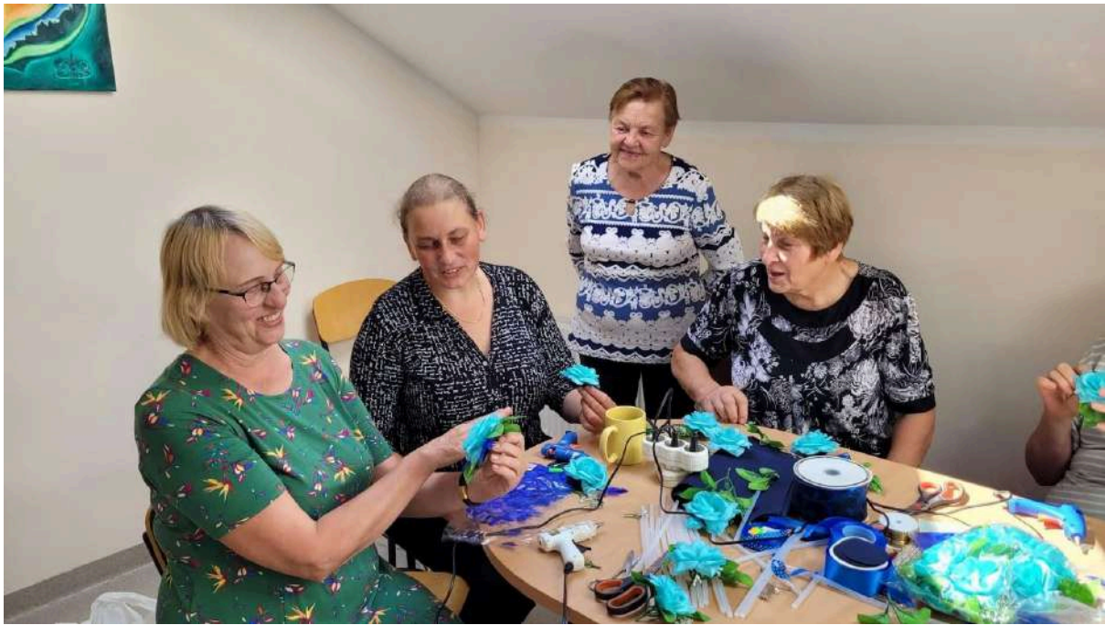
Ηλικιωμένοι από τη Λιθουανία, Šveikšna, 2022

Βασικά στοιχεία της θεραπείας τέχνης: Τι είναι η θεραπεία τέχνης, ποιες είναι οι τεχνικές θεραπείας τέχνης, ποια υλικά μπορούν να χρησιμοποιηθούν κ.λπ. είναι οι βασικές πληροφορίες που παρέχονται σε αυτό το μέρος.