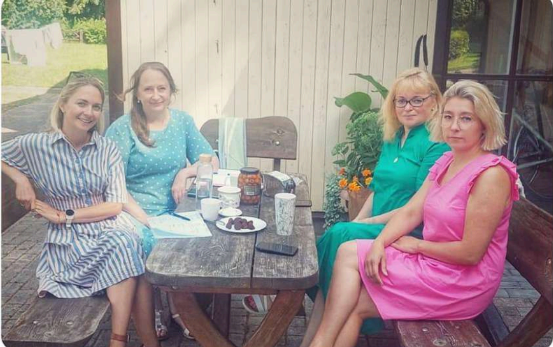
ERCC arařtırmacıları ve mlakat katılımcıları (Litvanya, Nida, 2022)

alıřmaya sosyal hizmet uzmanları, sađlık alıřanları, istihdam uzmanları, psikologlar, sanat terapistleri ve diđerleri dahil olmak zere eřitli alanlardan uzmanlar katılmıřtır. Proje ortađı altı lkede (Litvanya, Gney Kıbrıs, Danimarka, İspanya, Trkiye, Polonya) toplam 33 uzmanla grřlmřtr. Her lkedeki ok eřitli uygulama ve deneyimlere rađmen, yanıtlarda nemli bir farklılık bulunmamıřtır.