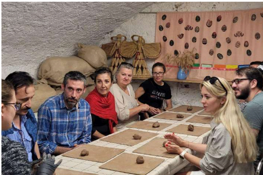
Proje ortakları kilden sepet yapıyor, Klaipėda, 2023

Yaşlılarda bilinçli farkındalık temelli sanat terapisi (Rappaport, 2014) eğitimi yukarıda bahsedilen yöntemlere ek olarak birçok farklı teknik ve yöntemle uygulanabilmektedir. Bu eğitimler yaşlı bireylerin kendilerini ifade etmelerine, yaratıcılıklarını ortaya çıkarmalarına ve psikolojik sağlıklarını korumalarına yardımcı olmaktadır.