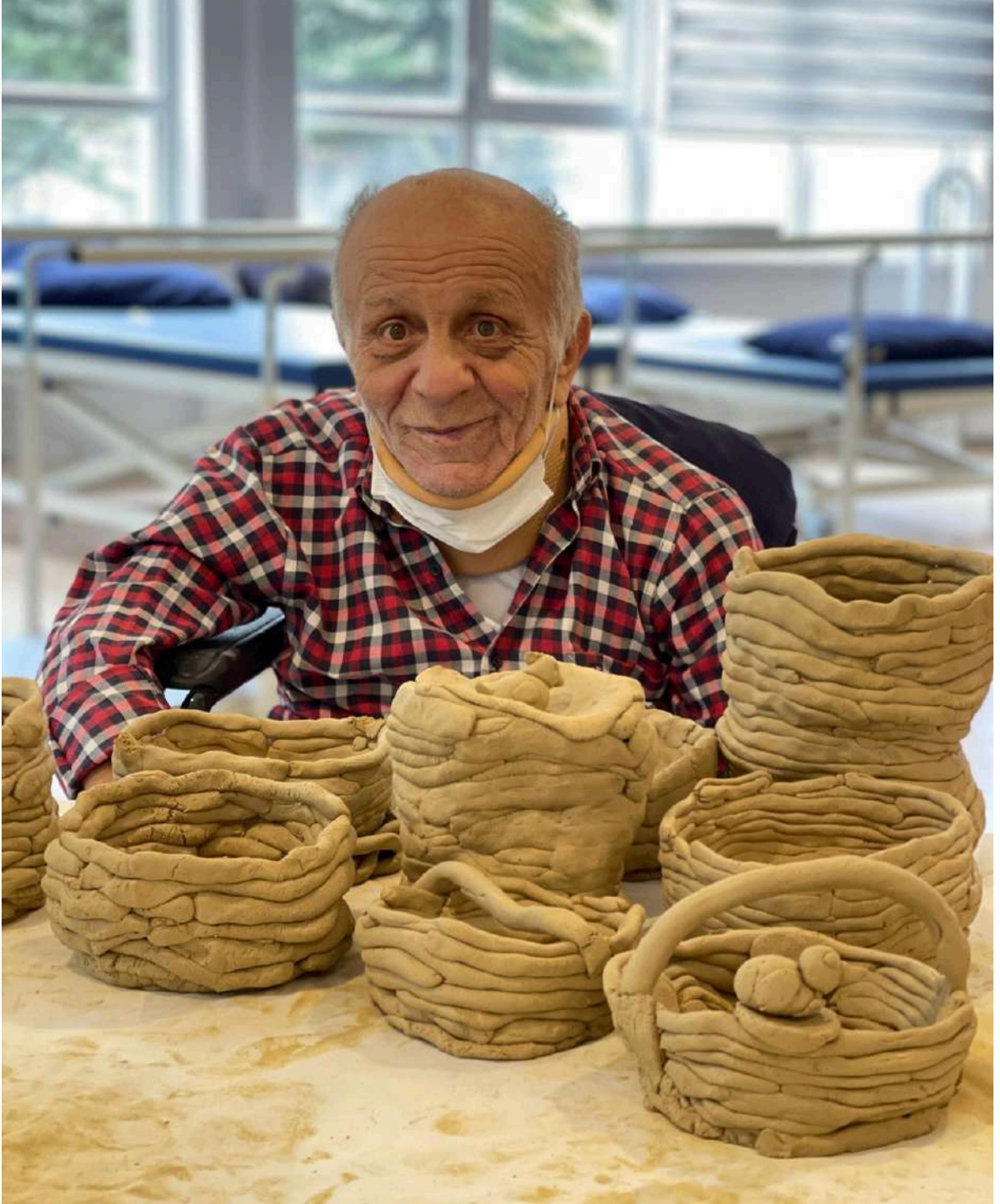
Türkiye'den kil el sanatları ile uğraşan bir yaşlı

Kil. Kil yapımı sanat terapisinin popüler bir parçasıdır. Özellikle tarih öncesi dönemlerde insanlar temel ihtiyaçlarını kilden yaptıkları mutfak eşyaları ile karşılardı. Günümüzde ise kil sadece hayatı kolaylaştırmakla kalmıyor, aynı zamanda ruhsal rahatlamaya da yol açıyor. Bu sayede kişi hem el becerilerini geliştiriyor hem de kil aracılığıyla negatif enerjisinden kurtulma fırsatı buluyor. Kil ile temas kişide olumlu ya da olumsuz duyguların ortaya çıkmasını tetikliyor.