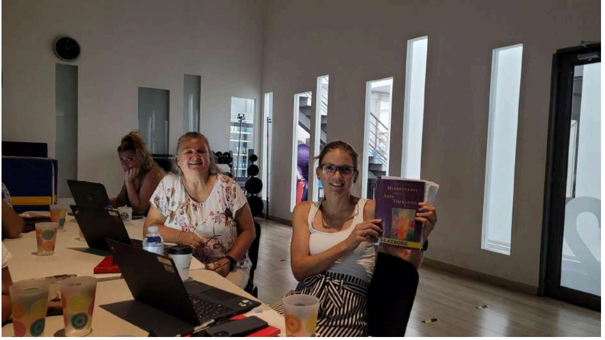
Danimarka'dan proje ortakları L. Rappaport kitabını sergiliyor, Lefkoşa, 2022

MBAT, Laury Rappaport tarafından tanımlanan farkındalık yaklaşımı ve sanat terapisinin birleşiminden oluşan bir terapötik tedavidir. Yaklaşım, farkındalığın ardındaki fikri, kendinizi sanatsal ifadeler yaratmanın yaratıcı sürecine kattığınız ve böylece kendinizi bilinçli bir şekilde keşfettiğiniz yaratıcı etkinliklerle birleştirir.