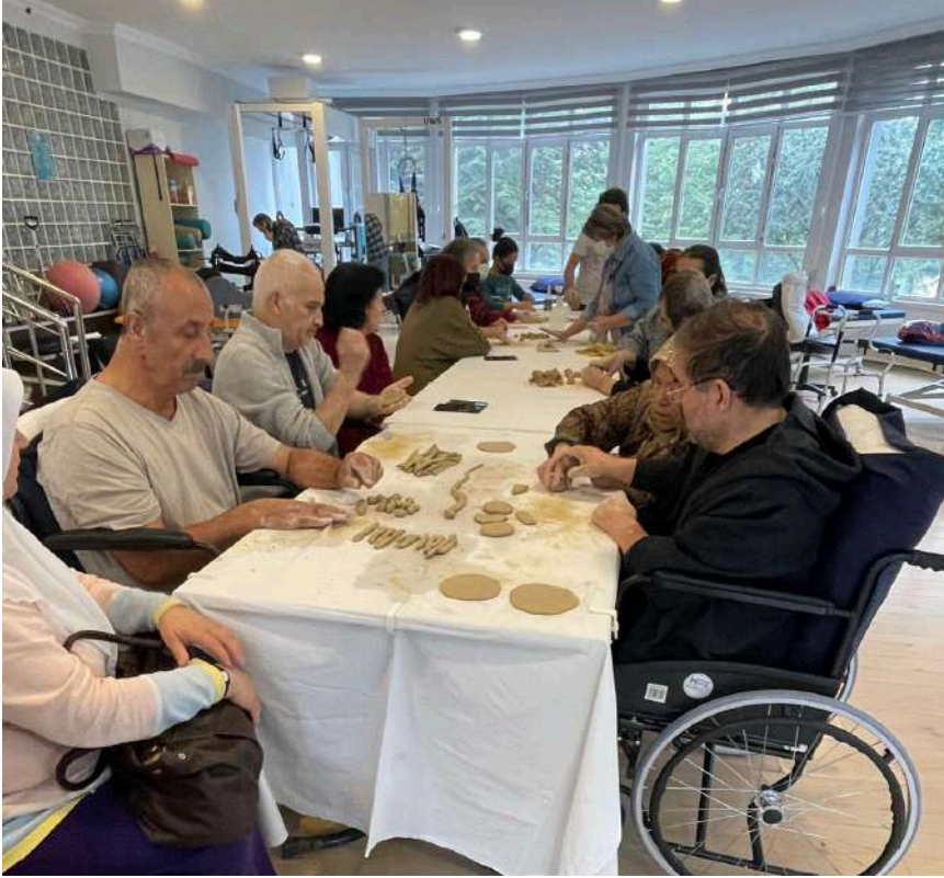
Kili elleri ile şekillendiren yaşlılar, Türkiye, 2023